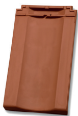
Dubbele welpan dekkende breedte ca. 253 mm

Minimaal 10 mm. ruimte houden tussen gevelpanflap en boeiboord!