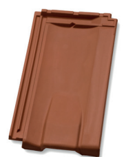
Ventilatiepan luchtopening ca. 15 cm 2