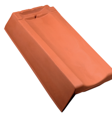
Gevelpan links dekkende breedte ca. 215 mm