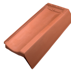
Gevelpan rechts dekkende breedte ca. 182 mm