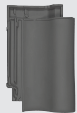
blauw gesmoord (876)