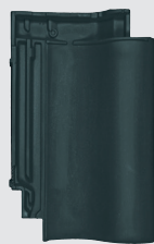
altfarben engobe (866)