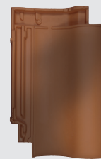
rood rustiek genuanceerd (812)