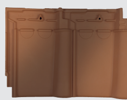
rood rustiek genuanceerd (812)*