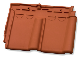
Ventilatiepan luchtopening ca. 11 cm 2