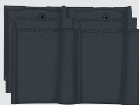
Matzwart engobe (868)