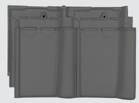
blauw gesmoord (876)

*projectgericht met afnameverplichting te leveren