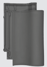
blauw gesmoord (876)