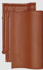
rood engobe (802)