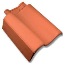
Gevelpan links dekkende breedte ca 275 mm