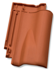
Ventilatiepan luchtopening ca 15 cm 2