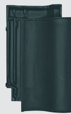
altfarben engobe (866)