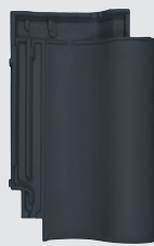
matzwart engobe (868)