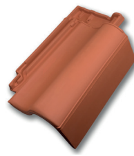
Gevelpan rechts dekkende breedte ca 175 mm