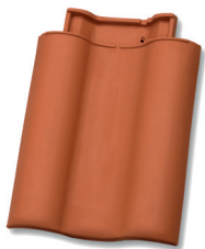
Dubbele welpan dekkende breedte ca. 302 mm

Minimaal 10 mm. ruimte houden tussen gevelpanflap en boeiboord!