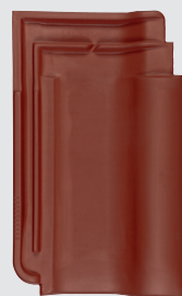
koperrood engobe (704)