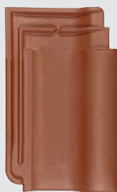
rood engobe (702)*