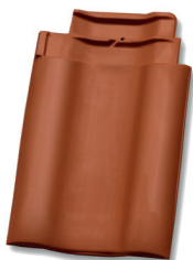
Dubbele welpan dekkende breedte ca. 275 mm

Dekkende breedte dubbele welpan: ca. 275 mm. Minimaal 10 mm. ruimte houden tussen gevelpanflap en boeiboord!