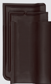
donkerbruin engobe (726)