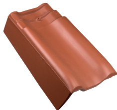
Gevelpan links NL dekkende breedte ca 217 mm