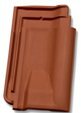
Ventilatiepan luchtopening ca 15 cm 2