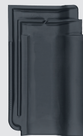
zwart engobe (765)