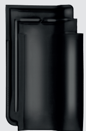
zwart edelengobe (767)