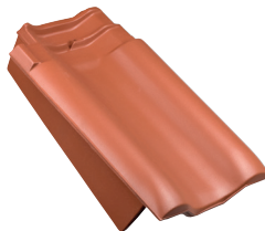
Gevelpan links DU dekkende breedte ca 204 mm