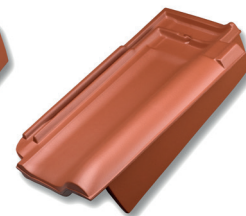
Gevelpan rechts DU dekkende breedte ca 129 mm