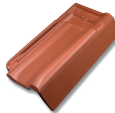
Gevelpan rechts NL dekkende breedte ca 148 mm